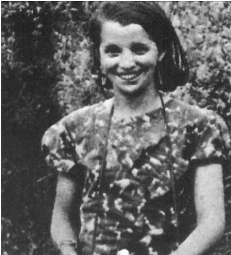
AIDA DE LA FUENTE

Era una militante comunista que murió con tan solo 19 años mientras se enfrentaba a las tropas del general Yagüe en Oviedo y trataba de frenar su avance con una simple ametralladora. Se convirtió en uno de los símbolos del PCE durante la Guerra Civil y es homenajeada cada año en el lugar donde murió, donde se colocó además una estatua conmemorativa.