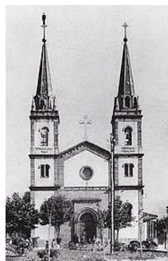
Cuartel de la Guardia Civil e Iglesia de San Pedro, algunos de los edificios que sufrieron daños