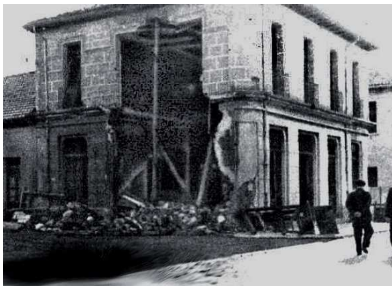
Cuartel de la Guardia Civil de Sama y Edificio Miramar dañados después de la lucha